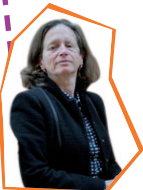
Pervenche Berès Députée socialiste européenne

Pervenche Berès, députée socialiste européenne, préside depuis 2009 la Commission de l'emploi et des affaires sociales du Parlement européen. Députée européenne depuis juin 1994, elle a présidé la Commission des affaires économiques et monétaires du Parlement européen de 2004 à 2009. Pervenche Berès a par ailleurs été membre de la Commission du livre blanc sur la politique étrangère et européenne de la France de 2007 à 2008, membre suppléante de la Commission des affaires constitutionnelles du Parlement européen de 1999 à 2008, et membre suppléante de la Commission des affaires juridiques du Parlement européen depuis 2008. Membre du Parti socialiste depuis 1982, Pervenche Berès a occupé différentes fonctions au sein du parti : présidente de la délégation socialiste française au Parlement européen et vice-présidente du groupe socialiste de 1997 à 2004, Conseillère municipale à Sèvres de 2001 à 2008 et Secrétaire nationale à la coopération et au développement du Parti socialiste (de novembre 1993 à juin 1994 et de décembre 1994 à octobre 1995), membre du Conseil national depuis 1993 et du Bureau national (1993-2004). Pervenche Berès est diplômée de l'Institut d'études politiques de Paris en 1978.